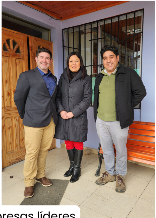
Charlas de empresas líderes en innovación agrícola.